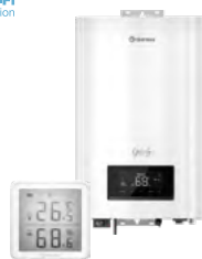
Электрические котлы и комнатные термостаты