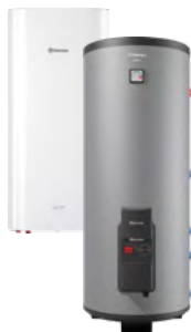
Комбинированные (косвенные) водонагреватели