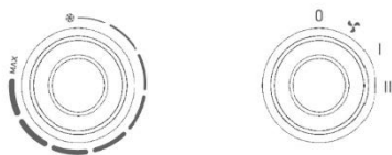
Рис.1 Панель управления

Регулятор слева: переключатель температуры, настройки в диапазоне от 0 до 125°C